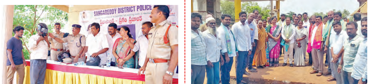
వాహనదారుడికి హెల్మెట్ ధరించమన్న డిఎస్పి వైదా నాయక్