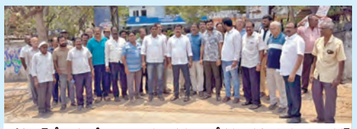
పడిపిపల్లిలోని మంజీరావాలర్షి ముందు అదోకన సందర్భంగా పాల్గొన్న వ్యక్తులు