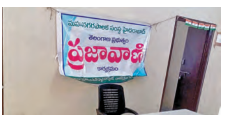
జంగమ్యేల్ సర్కిల్ ప్రజావాణిలో వెక్కిరిస్తున్న ఖాళీ కుర్చీ

బాంద్రాయణగుట్ట, ఏప్రిల్ 13, ప్రభాతవార్త : ప్రజా సమస్యల సత్కర పరిష్కారం కోసం రాష్ట్ర ప్రభుత్వం ప్రతి సోమవారం నిర్వహిస్తున్న ప్రజావాణి ప్రసారం వారింది. అధికారులు తూతూమంత్రంగా నిర్వహిస్తున్నారు.