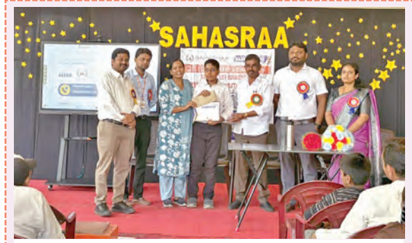
ప్రతిభ కనబరిచిన విద్యార్థులకు బహుమతి అందజేస్తున్న దృశ్యం