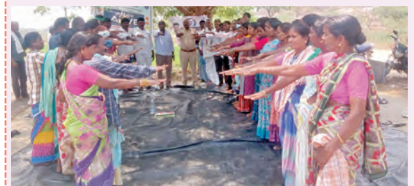
ప్రతిష్ట చేయిస్తున్న ఎన్ఐ, సర్పంచ్ తదితరులు