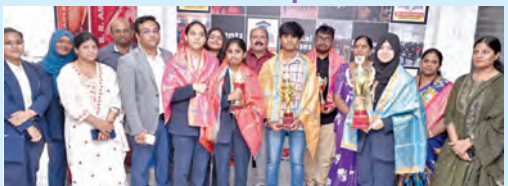
రాష్ట్ర స్థాయి ద్వారా వారు సాధించిన విద్యార్థులకు సత్కారము అందజేస్తున్న అధ్యక్షులు