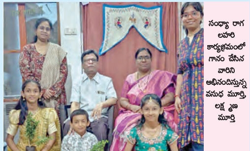
సంధ్యా రాగ లహరి అభినయించే మధ్య మూర్తి లక్ష్మి మూర్తి